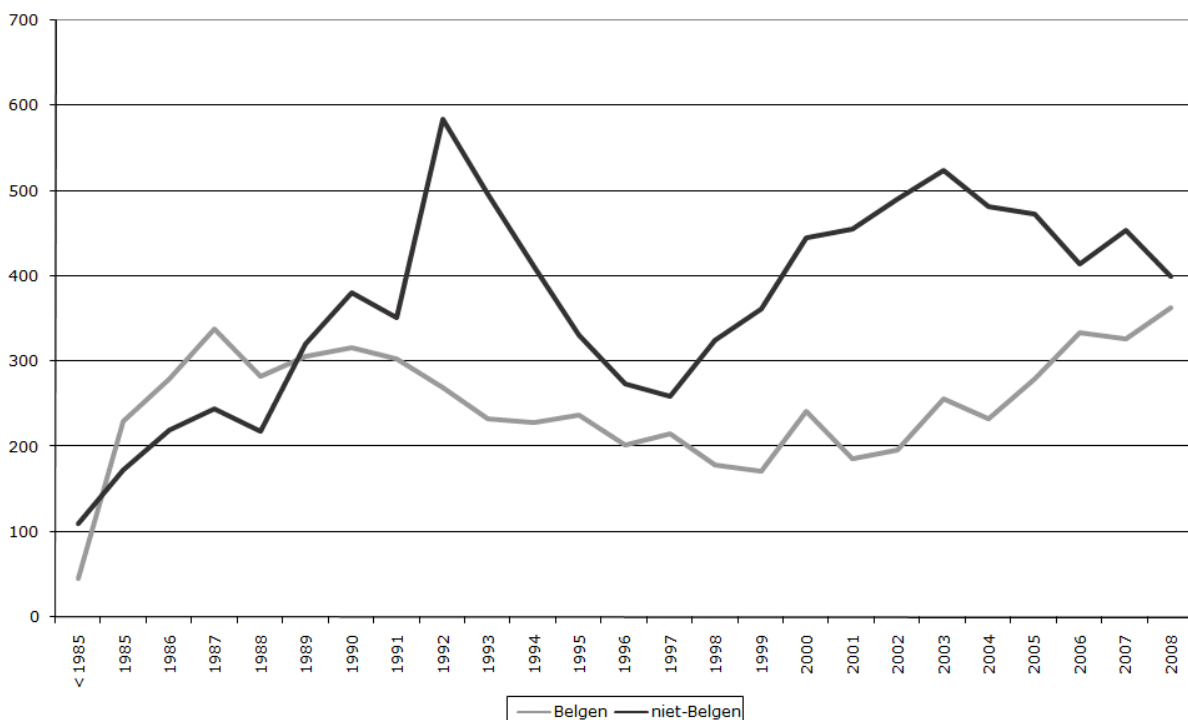
Figuur 1: nieuwe diagnoses naar nationaliteit en jaar van diagnose (1985-2008, absolute aantallen).

De cijfers van 2008 bevestigen de eerder geformuleerde trend waarbij het aantal nieuwe diagnoses bij Belgen en niet-Belgen ongeveer even groot wordt.